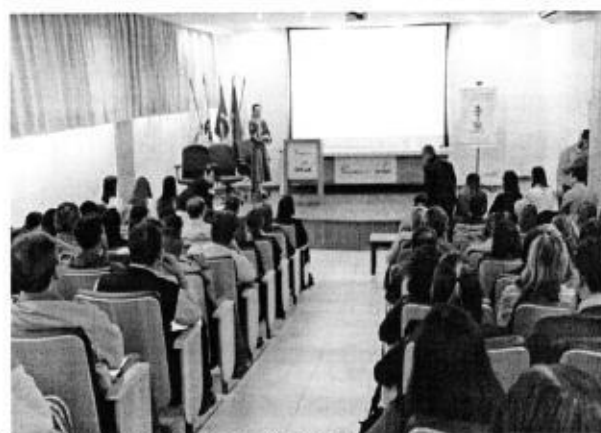
PALESTRA DICAS DE ENTREVISTA E CURRÍCULO